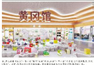
黄冈馆内部展示区，陈列着各类书籍和文创产品。