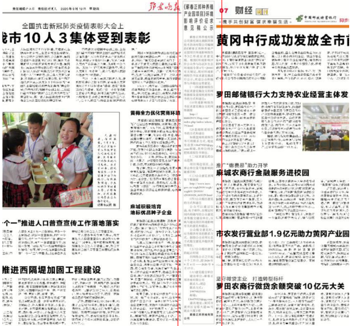
图 3-2 项目征求意见稿公示信息第一次报纸公示照片（2020 年 09 月 10 日）

晚报上将征求意见稿公开信息进行了公示，鄂东晚报为项目所在地公众易于接触的报纸，符合《环境影响评价公众参与办法》第十一条要求。公示报纸照片见图 3-3 及图 3-4。