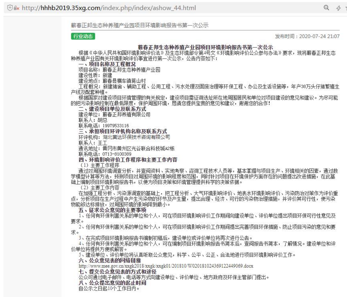
图 2-1 项目第一次公示截图

蕲春正邦养殖有限公司于2020年7月24日在进行了第一次网上公示 ( http://hnhb2019.35xg.com/index.php/index/ashow_44.html ), 符合《环境影响评价公众参与办法》在项目所在地相关政府网站公示的规定, 公示截图如下。