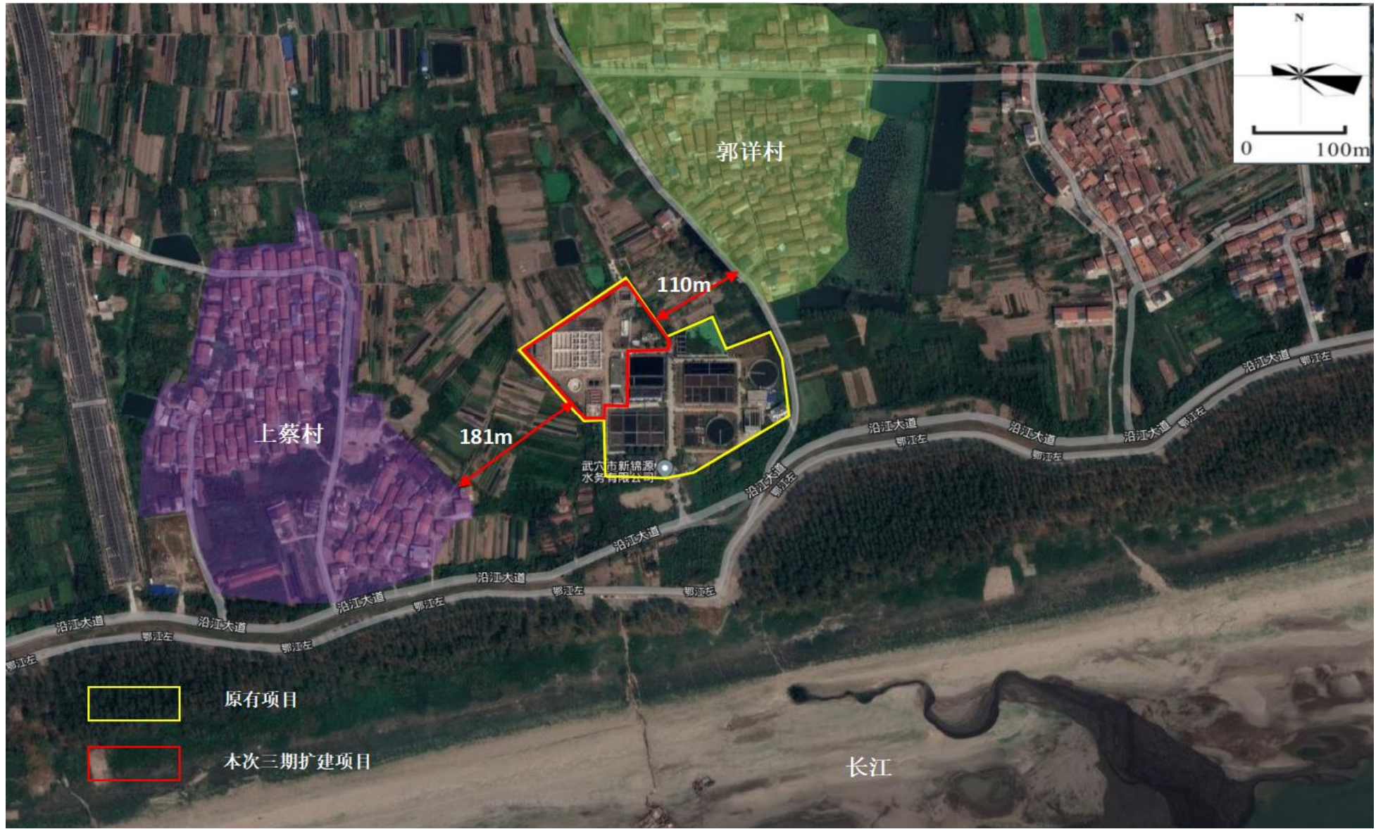
附图2 周边环境关系图