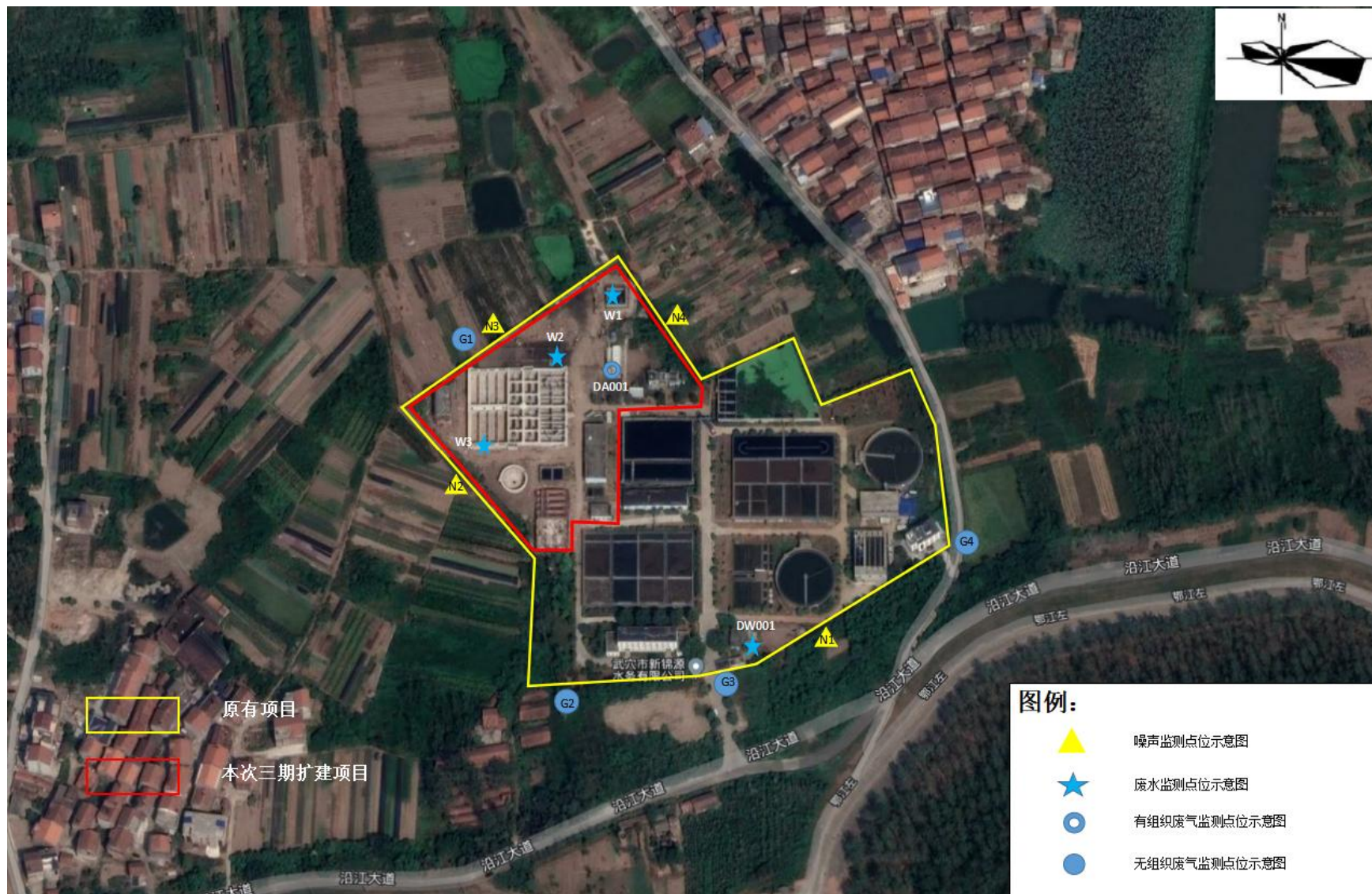
附图4 项目验收监测点位图